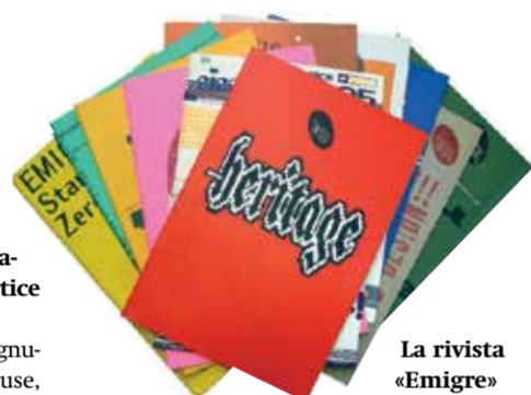
La rivista «Emigre»

Le tecnologie in grado di trasformare ognuno in produttore, stampanti 3D incluse, esistono e saranno sempre più convenienti: ma in che modo si useranno? Se si guarda alla rivoluzione generata dal maturo settore Desktop Publishing (Dtp) iniziata molti anni orsono, è possibile constatare come essa abbia cancellato in breve tempo le tradizionali pratiche di stampa evolute, da Gutenberg in poi. Tuttavia, a fronte di una drastica diminuzione di spese e tempi di produzione, della massima libertà compositiva, di periferiche in grado di produrre elaborati sempre migliori e tecnicamente ineccepibili svincolati dalla tiratura, il livello qualitativo degli artefatti grafici autoprodotti è mediamente molto basso e sovente realizzato in barba alle regole più elementari di percezione visiva. In mezzo a tanto rumore di fondo, tuttavia, è bene ricordarlo, sono stati prodotti anche materiali preziosi, come ad esempio «Emigre», influente rivista californiana di saggi e scritti sul design grafico uscita dal